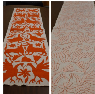
Table Runner and Table Cloth Artist Unknown, Hidalgo, Mexico Cotton Taylor Collection, Mesilla, NM